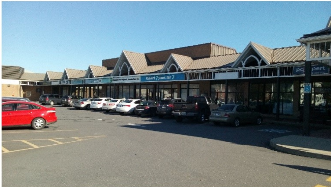
VUE DU STATIONNEMENT DEVANT LE LOCAL #47 (FACE A LA RUE WELLINGTON)

NOTE GENERALE: CE DESSIN EST À TITRE INFORMATIF SEULEMENT. LES DIMENSIONS EXACTES DEVRONT ÊTRE VÉRIFIÉES SUR PLACE PAR UN ARPEUTEUR ET UN ARCHITECTE.